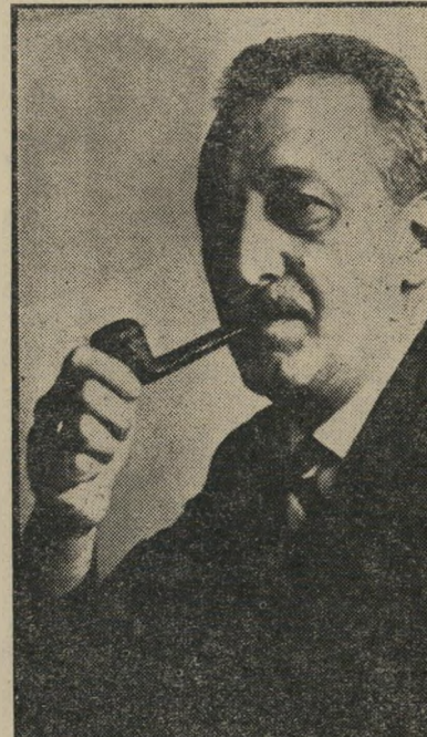
מנכ"ל דשעבר וידרא בעיקבות השינוי - שואה?

עולמית - בניגוד לדעתם של כל המומי-חיים, ובמחיר סיכון מיליארדים של משלם המיסים.