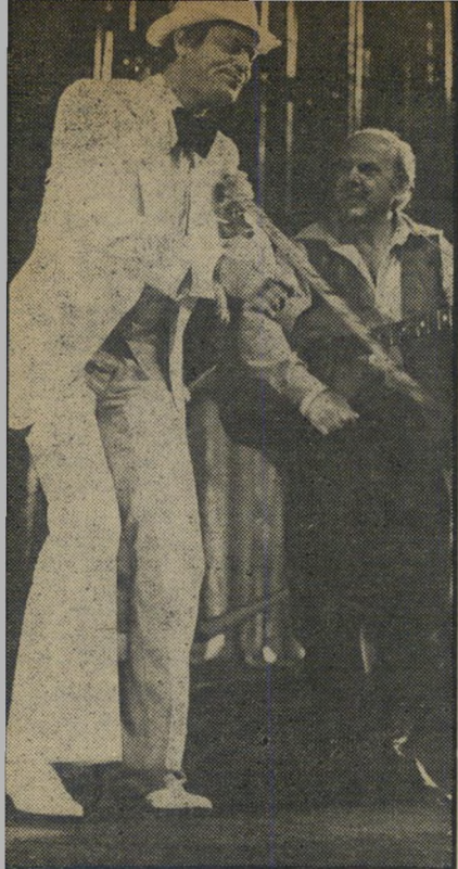
שפר ותאומי ב, כטוב בעיניכם באגס באני במקום שייקספיר

בפזמונים ובגופיות טריקו — קם רק מי תוס אחד שהצליח לעלות עליו בהדיו השערורייתי: הטנגו האחרון בפריס. מיתוס הטנגו גרר אחריו סדרת מחור לות משוגעים, החל בטנגו האחרון ברומא וכלה בוולאס הראשון בברלין (ואם כל הסרטים הללו לא הופקו עדיין בפועל, הרי שזכויות על השמות נרשמו כבר. מן הראוי להזהיר כאן את מי שיחשוב שקריאת הטנגו בעברית תעזור לו לגלות דברים שלא הבין בסרט. (הכוונה איננה לחמאה המפורסמת, כי אם למשמעות ה' פוליטית, לבעיות הפסיכולוגיות או לפי-רוש הפחד הנורא מן המוות, המוביל את הגיבור ליחסים מיוחדים במינם.) הסיבה פשוטה: התסריט קדם לכתיבת הספר — וכל מעלותיו של הסרט פשט נמוגו ואינן בסיפור. אמת שגם לרומנים