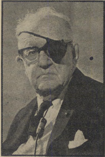
תתיאדמירל ג'ון פורד נכסי צאן צלולויד

שמו היה שון אלויזיוס אירפרנה. הבן ה-13 במישפחת מהגרים איריים שהתיישבה במרילנד. בגיל 18 נראה היה שיעשה קאריירה בעיסקי-עור. תקופה מסוימת עבד כשוליה בבית-חרושת לנעליים. ואחר כך עלה בדרגה, הצטרף אל מחלקת הפירסום של המיפעל. אלא שבאותו זמן התארגנה על החוף השני של ארצות-הברית תעשייה