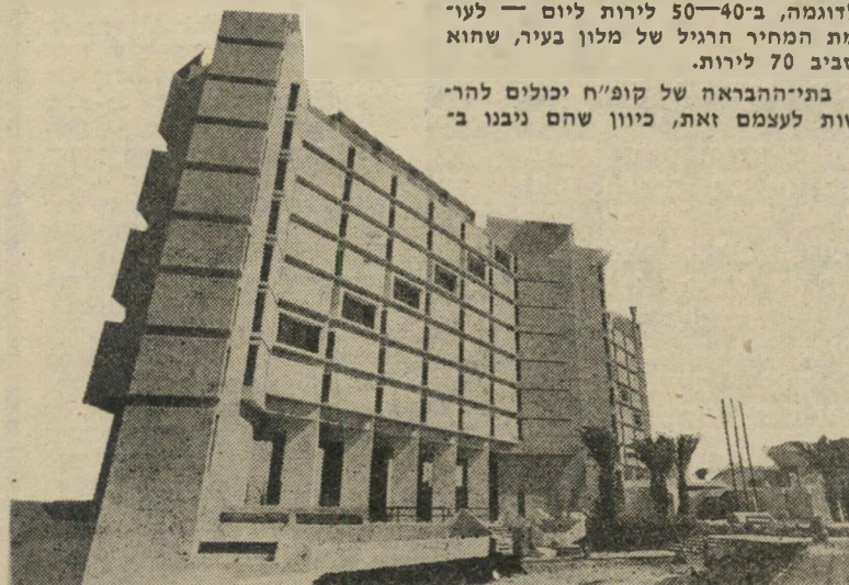
בית-ההבראה החדש של קופ"ח בטבריה תייר במקום חבר