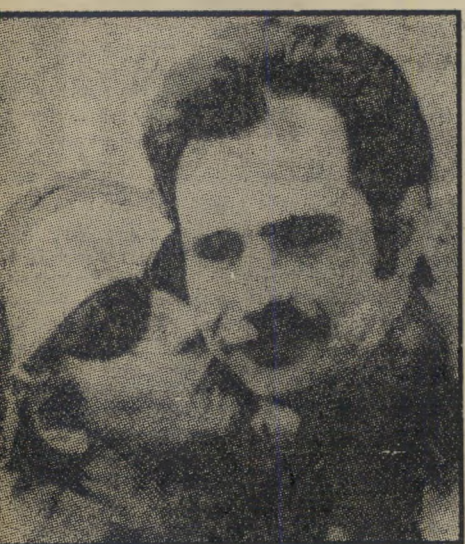
אלכסנדרוס פאנאגוליס ואמו טווע לרצח

לרגל אחד נצטט לבנו השבוע. זה היה כאשר ראינו בעיתון זר תצלום-חדשות: אמו של אלכסנדרוס פאנאגוליס מתבקת את בנה בן ה-34 עם שיחרורו מהכלא ביוון.