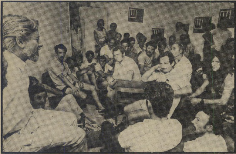
חברי קיבוץ גבים בשיחה עם אבנרי במערכת יחס מיוחד

ביושבו על שולחן הכתיבה של עורך-הכיתוב, שוחח אבנרי במשך שעה וחצי עם הקיבוצניקים הקשוחים. הם המטירו עליו שאלות מכל הסוגים. אבל נראה שדווקא ענייני העולם הזה מעניינים אותם יותר מענייני כנסת והסתדרות. מדוע מפרסמים שמות של השודים לפני שהורשעו בדיון? (אבנרי הסביר את הנימוקים בעד ונגד, הביע את דעתו שבחשבונו הסופי טובת הציבור וטובת העצורים עצמם דורשת את הפירסום; כדי למנוע מעצרים שרירותיים.)