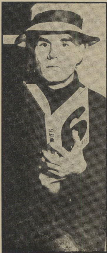
אנדי ווארהול, הצייר שהפך לבמאי סרטים מעוררי-מחלוקת, בין אלה הרואים בהם זבל ותו לא, לבין אלה הרואים בהם „משמעות נסתרת“

הוא לקח מצלמה, העמיד אותה במרכז החדר, הצטייד בגלגלי סרט קצרים באורך של שתיים וחצי דקות כל אחד. אחר כך