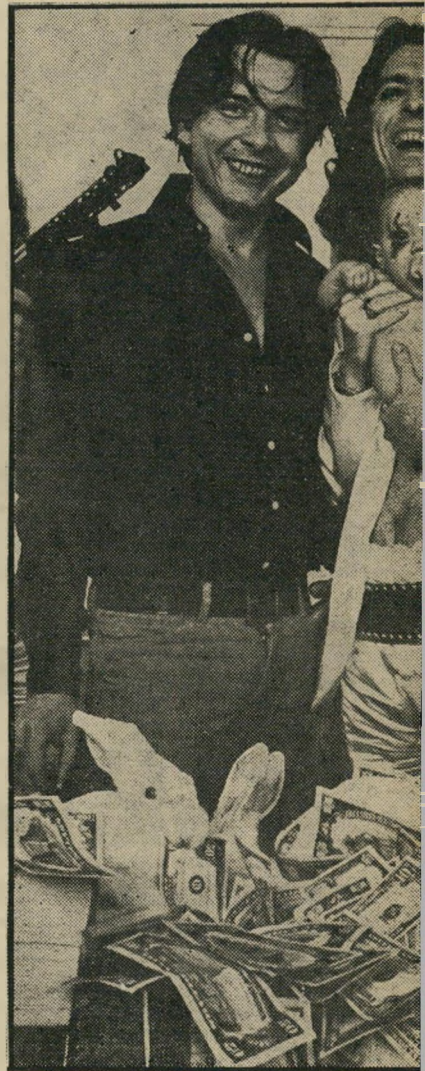
— מחזיק בידו תינוק המאופר באיפור המזויע הזמר בן ה-24 והנראה מעבר ל-30 את המוני צחי: "אני רוצה הרבה כסף", הוא אומר.

גינס ג'ופלין, גימי הנדריקס, ג'ים מו-ריסון — כולם מתו עקב שימוש מופרז בסמים. אלטון ג'ון מרכיב מגבים למש-קפיו, מסור מקלטי טלוויזיה בכל סינות