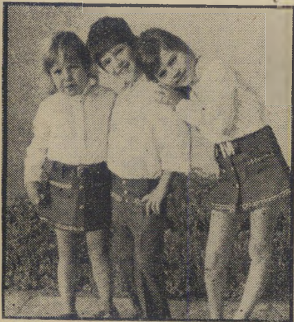
ילדי משפחת רוה מצב של התייבשות

אכזבה טפחה על פניהם כמעט מההתחלה. "כבר מהתקופה הראשונה החלו צומחות בעיות ארגוניות ואנושיות קשות", סיפרו אנשי המושב, "למקום הורד טבח קשיש, חולה ובלתי כשיר לתפקידו. לרוב האנשים שנשלחו למקום באמצעות האחרון החקלאי לא היה רקע מתאים כדי לחיות חיי שיתוף במושב או לעבוד בחקלאות. רוב היורדים לא ידעו אפילו להשתמש בטרקטורים. לא נשלח רכז מקצועי למקום שידריך את האנשים ויעמיד את הישוב החדש על הרגליים".