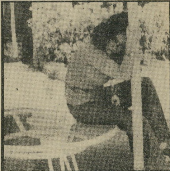
הימנית יושבת על שולחן בחצר הבית, משטינה ראשה על העמוד המחזיק סוכך נגד השמש. בחמונה המרכזית: סופיה לורן ניגשת אליה כדי לברר מה קרה. בתמונה משמאל: אליזבט טיילור הבוכיה, מספרת לסופיה לורן על הצרות שאירעו לה אותו יום.