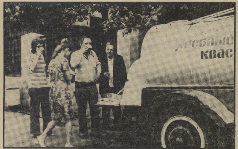
אנמון שותה קבאס ממוסבאית ברחוב מוסקבאי חג לכל העיר

כאשר צרפת כולה השתעשעה עדיין ב"סרטי הריאליזם הפיוטי שלה, התבוננה בזילזול בקולנוע שמעבר לים, היה מלוויל מטורף לסרטים אמריקאיים, כאשר ישב