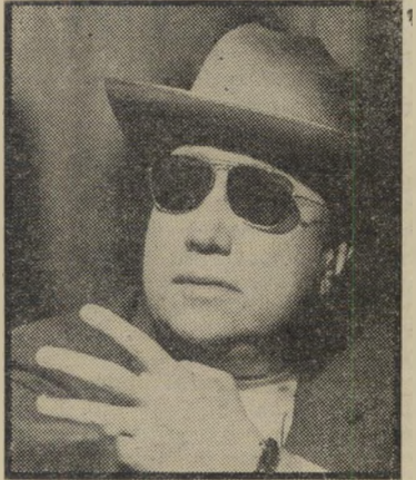
במאי מלוויל אמריקאי בפאריס

עם מותו של ז'אן פואר מלוויל בשבוע שעבר, אבד לקולנוע הצרפתי אחד היוצרים המקוריים, המעניינים והמזוהים ביותר שהיו לו מעודו. צרפתי בכל רמ"ח של כל סרט.