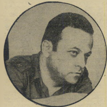
הרתן ברציון — חצי מליארד

בימים אלה השלימו יורשיו של נחום זאב ויליאמס את חלוקת רכוש המיליארדים שלו ביניהם. החלוקה בוצעה בשיתוף-פעולה מלא, בצורה שלא הפגום ברכוש.