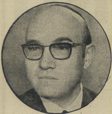
רואי-החשבון מן רק רבע מיליון