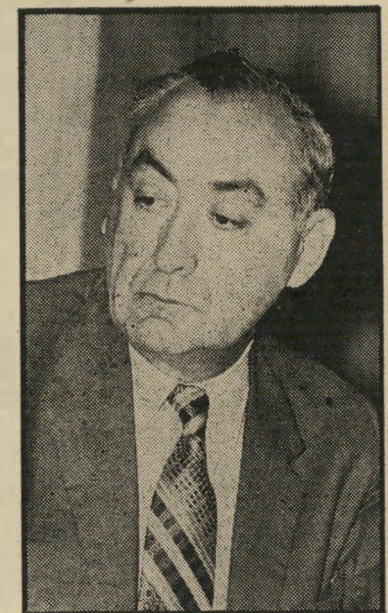
יודי דנישטיין טובה חמורת טובה

רוט היה אמור לקבל מישרה בכירה בבנק לפיתוח התעשייה - שהבוס שלו