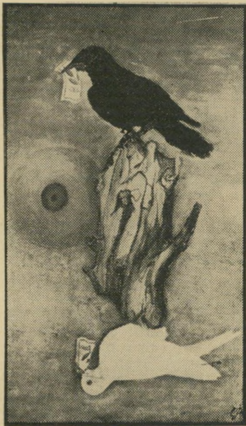
מלחמה-שלום • ולשוב אליו

ואז באה מלחמת ששת-הימים. ניוזכר חליף: „הייתי בטוח שאהרג במלחמה הזו. משהו פאטאלי ניקר בראשי כל העת ואמר לי, תראה חביבי, עברת בחיים הרבה, אבל זה יהיה הסוף שלך. ומה קרה? המלחמה עברה ולי אפילו לא הגיחו להשתתף בה. פשוט לא גייסו אותי. נש-ארתי בריא ושלם בגופי, אבל נפשי היתה חולה ומטורדת. כל מיני שאלות צצו במוחי ולא נתנו לי מנוח. הוזהות היהודית נראתה לי עניין אבסורדי ללא הגיון. להיות עם נבחר, להיות יהודי עם כל זכרונות ה- השפלה ולהרגיש גא פתאום — ויחד עם זאת לרצות בשלום ולא להאמין שאכן יבוא אי-פעם. לרצות בשלום ולא להאמין שהאדם הגיע לבגרות מספקת כדי לבצעו. ואז, התחלתי לצייר. תחילה ציירתי את החייל התרוג שנישקו מוצב לידו כגל-עד וקסדתו שלא הצליחה לשמור על ראשו מתמוגגת בשירטוט שדה-אם, שאף אהבתה לא יכלה להגן על הבן האחד מגורלו.“ את הציור הזה לא יראו בתערוכת ה- בכורה של מנחם חליף, בגלריה יפו-העתי-קה: זה היה התרגיל ששבר את גב הגמל. אחרי הנסיון הראשון לעצב את הזכרונות, הלבטים והעזוועים של ישראל-יהודי שעבר את השואה ואת ששת-הימים גם יחד, באו עשרות נסיונות. כולם גם יחד חזרו אל הרצון הישן לצייר. ואכן, ציוריו של מנחם חליף נראים כ- עריכת חשבון עם אלוהים ועם כל התס-ביכים והניגודים שאלוהים זה הוריש באופן בלתי אמצעי לחלוטין לבן העם הנבחר. הם ציורי מחאה וזעקה. ציור לדוגמה: חינוך. דמות האב ושדי האם מלווים את ילד בחרדה — מה יהיה זה כשיגדל? „אלים“ עונה חליף בצער. „אלים כמו כל הילדים המשתקים בנושק-צעצוע, וגדלים כזאבים.“