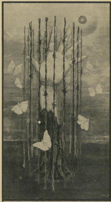
כמיהה • לטשטש

מלחמת ששת הימים עשתה דברים שונים לאנשים שונים. היא הפכה רודפיי שלום לתוקפניים, לוחמים עזים לרודפיי