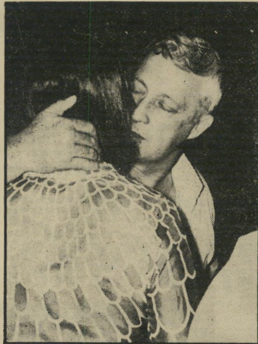
האזרח אריק שרון מנשק ידידה

באופן מעשי: אני מציע שהכנסת תמנה ממונה לענייני-ביטחון, אישיות בכירה שתפעל