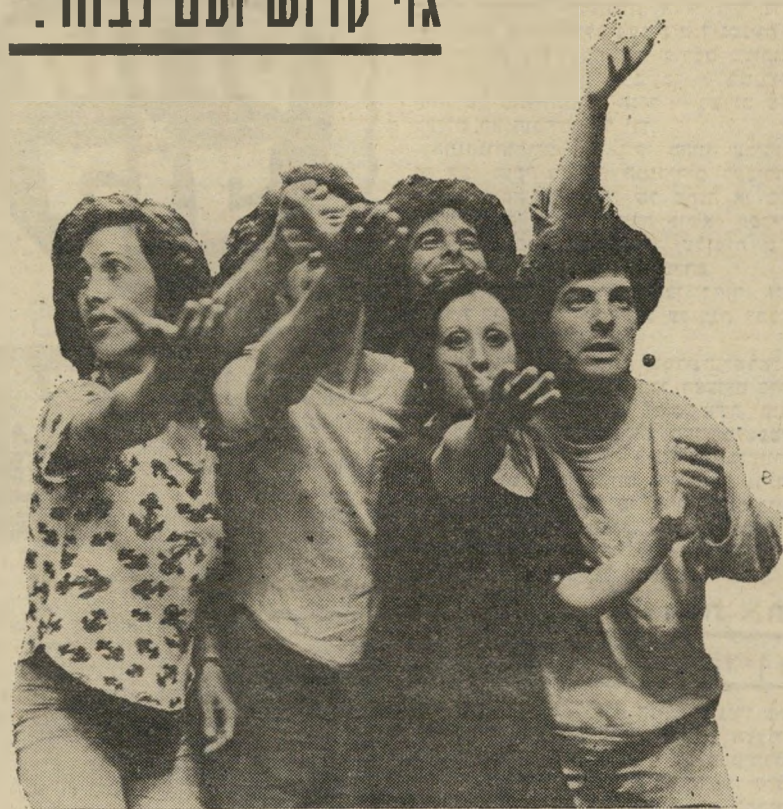
להקת ה„האן” ב„עיר אחת” שירפץ — או חיסול?

לפי מוסכמות, וחושבים שלדתיים יש זנב. עד כאן, דברי הבמאי.