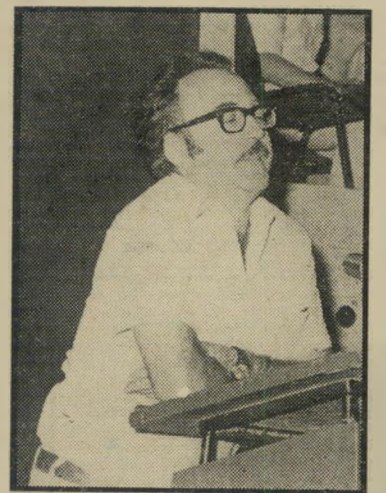
מק"יסט טיימלכאום גשרים פתוחים