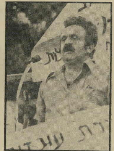
אישי-ש"ה פתר דלת פתוחה

מכל הבחירות, היה כדאי למק"י להיכנס לכנסת ברשימה משותפת כוללת, שבראשה יעמוד איש תנועת העולם הזה. כצורה זו היתה