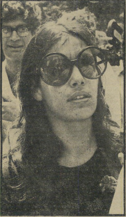
ניבה דנור „אמרת“

אולם הזמן עשה את שלו. בשורה של מיבצעים — בפיתחת-רפיה, בעקרבה, ב"ברעם ואיקרית — מצאו אנשי העולם הזה ואנשי שי"ח את עצמם בשורה אחת, יחד עם האופוזיציה של מק"י. אותו מצב