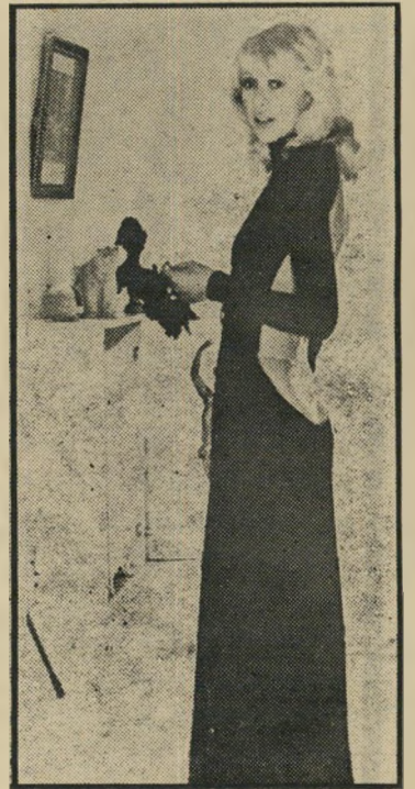
מיריי ד'ארק ב"הבלונדי עם הנעל השחורה" אנטומיה של בימיו

הרעם הרחוק הוא בסך-הכל סרטו הדי שני בצבע, ומנהלי פסטיבל ברלין ודאי