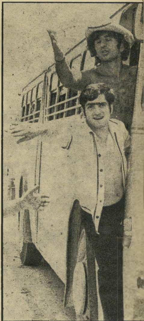
פנו דרך! שניים מפעילי מרד הגרוזינים מפנים דרך, מבעד למחסום של חבריהם, לארץ טובים שהוביל ילדים בדרך לאשדוד.

'אבל גם לעבוד לא נותנים. אבא של בעלי — רופא, ובעלי היה צריך ללכת לעבוד בנמל. אבל מה? לוקחים מה שיש. או אחרי שהוא עבד בנמל עשרה חודשים — פיטרו אותו. 'למה? אצלנו ברוסיה, אם בן-אדם עובד בסדר, לא מפטרים אותו. סה יותר