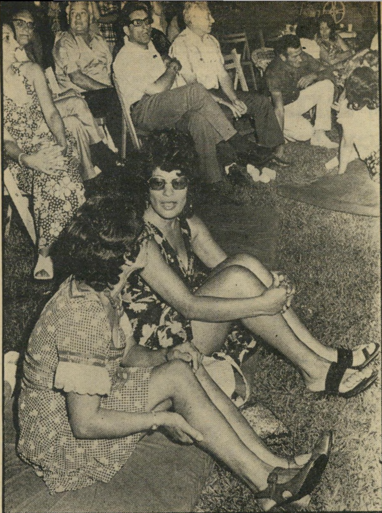
קומיץ מזרונים „מסביב למדורה” נוסח 1973. לנוחיות האורחים שהוזמנו לשיר מסביב למדורה מלאכותית, הועמדו כיסאות נוחים, או מזרונים גומי רכים שנועדו לשמור על כרי הדשא המטופחים בוילה.