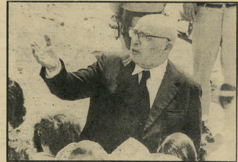
שרהאוצר, ספיר הכל זה הוצאות חברה

ישראלי שחפצה נפשו בחשיש, והמואס במחירים המפולפלים שביפו או במעגן הסיירות שליד הירקון בתל-אביב — יגלה גן-עדן של שוטים אם ירד לסיני. בקידמת הציהאוי, ביום השוק בשייך-זוויד, הגערך מדי יום שישי, או בזה שבכפר שן, המת"קיים בימי א', נמכר החשיש בגלוי, כס"י