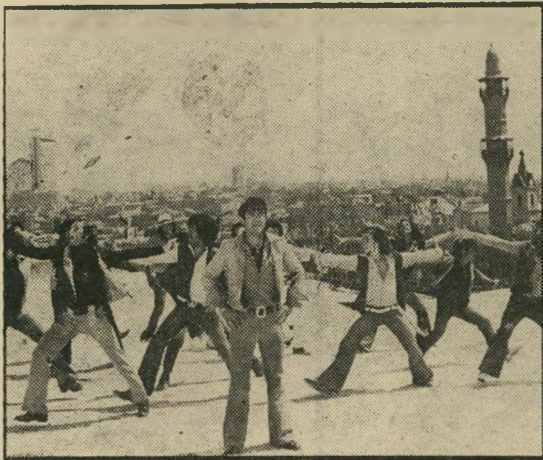
גאון ורקדנים: שלאגר חולני

דבר אחד צריך לציין גם לשבח המקום: שלא כרגיל, הוצג הסרט בשלמותו, מהתי חלה ועד הסוף, ללא הפסקה באמצע, המזנונאים הסתפקו כנראה בקוקטייל ש-אירגנו בסוף ההצגה, ויתרו הפעם על מכירת משקאות באמצע הסרט.