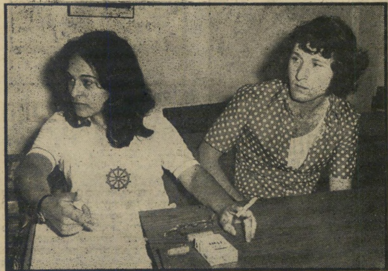
קצין הביטחון בינשמוק וסלקטורית ושרי "סלקטור" או "סלק את התור"

"לפעמים אומרים לנו: תוותרו על תעבירו אותם מהר למטוסים..." מתמרמת אחת הצעירות.