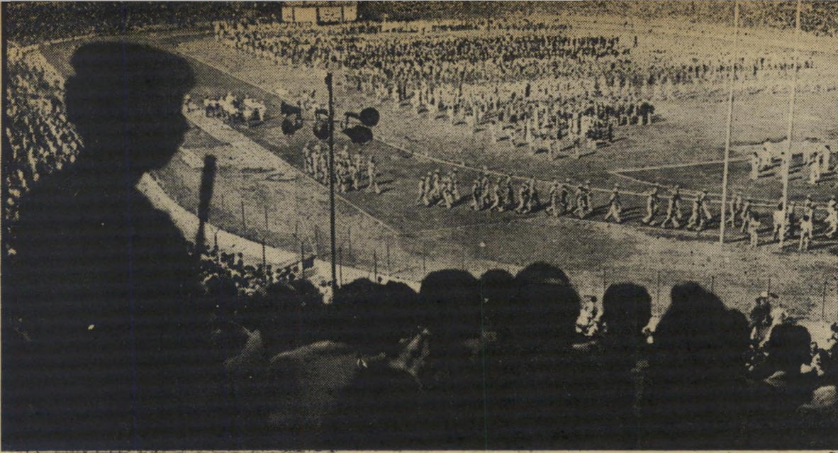
שומר מזוין מאחורי הקהל בטכס פתיחת המכביה התשיעית ביפחון כענף ספורטאי

מועמדים אחרי שירות צבאי, בעלי ציוד מתאים, מתבקשים לפנות לת.ד. 136, עבור "צלם", בצירוף תולדות חיים, ויחמנו לראיון אישי.