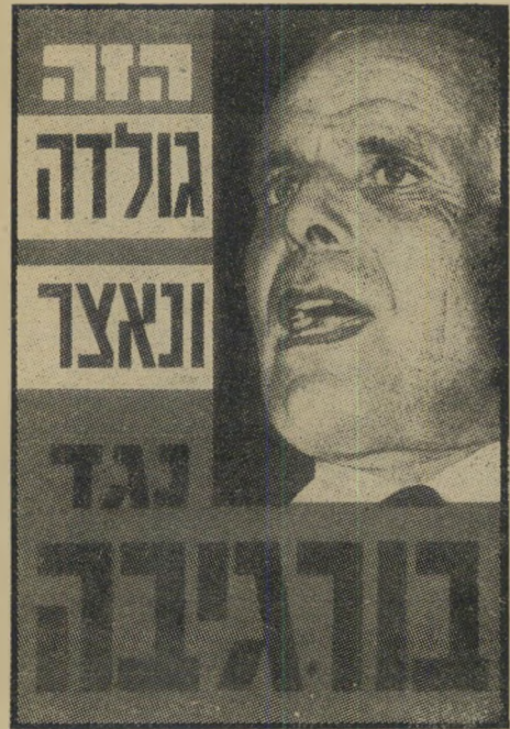
שער "העולם הזה" 1442, אפריל 1965 נבואה כמעט מדויקת -

מתי זה נכתב? לפני שבועיים, אחרי הצהרתו של נשיא תוניסיה חביב בורגיבה על נכונות לפגישה עם נציג ישראלי? או אולי הש- בוע, אחרי הצהרתו של שר-החוץ המצרי מוחמד אואיאת במועצת הביטחון כי מצריים מוכנה למשא ומתן ישיר ללא תנאי עם ישראל? אף אחת מהתשובות אינה נכונה. תשריט זה נכתב ופורסם בהעולם הזה לפני שמונה שנים בדיוק, אחי- רי יוזמת השלום הראשונה של הי- נשיא בורגיבה במרס 1965 (העולם הזה 1436). מה שאירע בישראל בי- משך השבועות האחרונים הוכיח שלא היתה זו סאטירה. היתה זו ליוזמות שלום ערביות. לא היה צורך בחוש נבואי כדי לפרסם אותה לפני שמונה שנים. שום דבר לא השתנה בעמדותיה, ובמדיניותה של ממשלת ישראל בשמונה שנים אלה.