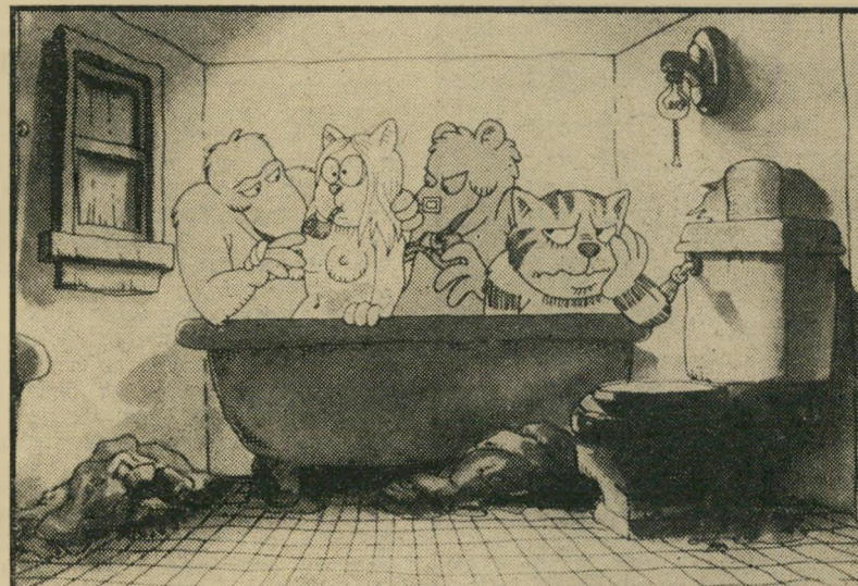
פריץ והשדוש באורגנייה באמכטיה לרחוץ את כל העכוזים

*** הצגת הקודנוע האחרון נה (פריז, ארצות-הברית) — מבט נוסף טאלגי אל עיירה אמריקאית קטנה בתחילת שנות החמישים, כשמוסרי השקפות העולם והחיים באמריקה היו שונים לגמרי מן המקובל היום. סרט רגיש ומשוחק היטב. *** סיזאר ורוזאלי (צרפת) — אשה הנקרעת בין איש מעש דינמי לבין צייר פופ חולמני. סרט מעניין, מרתק ורגיש של קלוד (אלה הם החיים) סוי