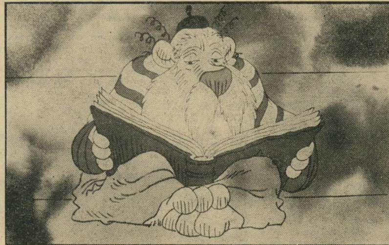
היחודי בבית-הכנסת לספק נשק לישראל