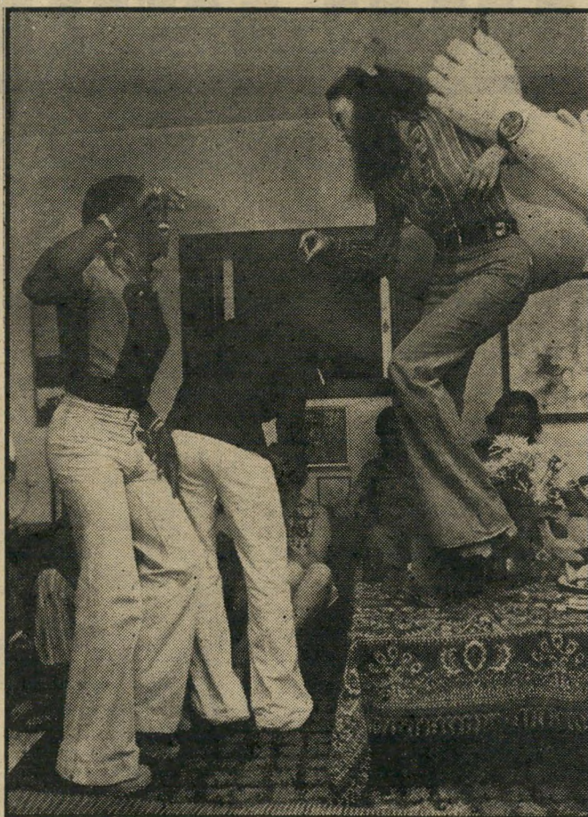
התרנגולים והביצים ג'קסון, המסיבה היתה גם פרייה מהבאס אברהם פרייה, שעזב גל, המורים יאנג וריקי