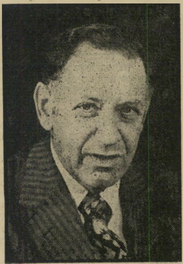
מנכ"ל עופר תשובה סתומה

בבית הקטן שוכנו כמהנדס הראשי של שיכון-עובדים בחיפה, פקיד בכיר נר-