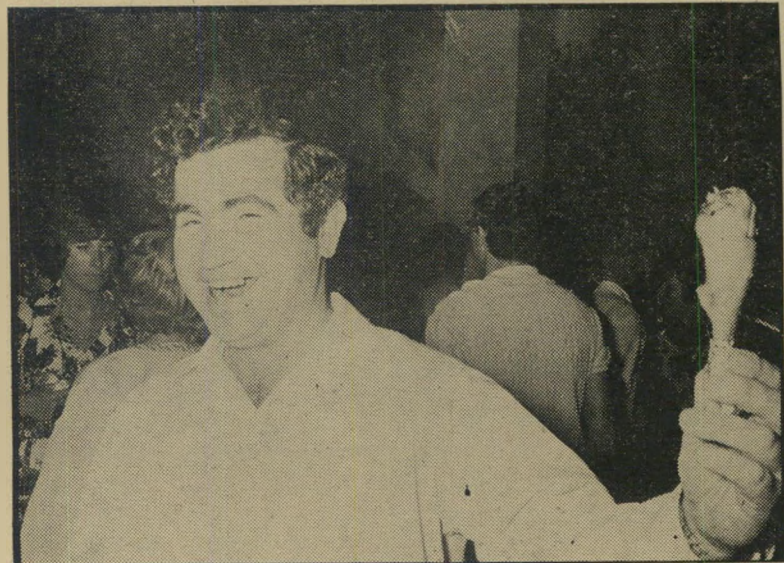
ח"כ המר - 1973 פוח מיוחדת

קיף על המאורעות מנקודת מבט אנושית בלתי רשמית. מה שמתקבל אינו מייצג אינו משקף ואינו מנסה להוכיח דבר. אבל, כך נראה לנו, הוא ודאי יותר מעניין.