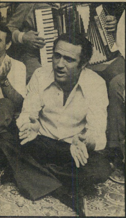
אדם לאדם ואבי מיס פחות, שרים שירי מולדת עד השעות הזריזות