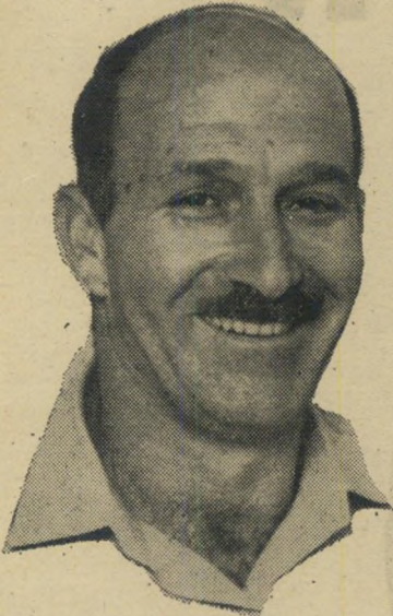
אלוף (מיל.) מוטי הוד זכות ראשונים

שהיא היתה כולה פרי גילוייו של עיתון אחד, הרי ספק אם בישראל היה עיתון אחד מרשה לעצמו אפילו להתייחס אליה. בארצות-הברית העלתה כל העיתונות על נס את אומץ ליבם האזרחי של כתבי הוושנינגטון פוסט, חילקה להם שבחים ולא היססה לספר לקוראיה על הצלחתם של כתבי עיתון אחד, העלול להיות מתחרה.