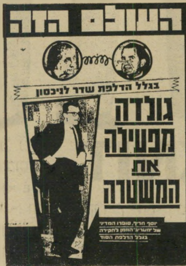
שער "העולם הזה" 1742 פירעון של שטר