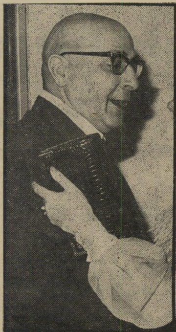
שר ספיר שתיהק שווה זהב

גם חיים שרת ניסה לטעון כי ההלואה בעצם לא תמומש, וקבלתה — אינה תנאי