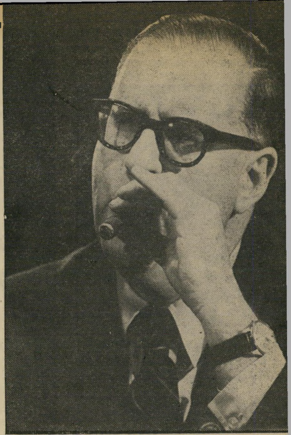
אבן: "לא רציני!"

● היהודים והערבים הם בני גזע אחד שחי בירידות ובאהוה במשך כל הדורות. הם יכולים לחיות בצוותא על בסיס של כבוד