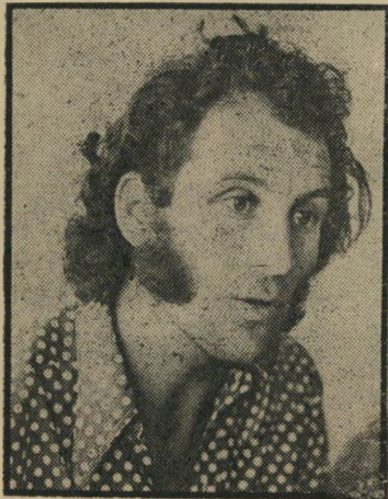
מוכה מתתיהו • חבילת שערות בבית

שוב הוריד הרס"ר את הדחליל מהגניידה. הנהג הפעיל את הסירנה, והתחלנו לנסוע לכיוון דיזנגוף. תוך כדי נסיעה רץ אחרינו השוטר הדחליל, פתח את הדלת ועלה