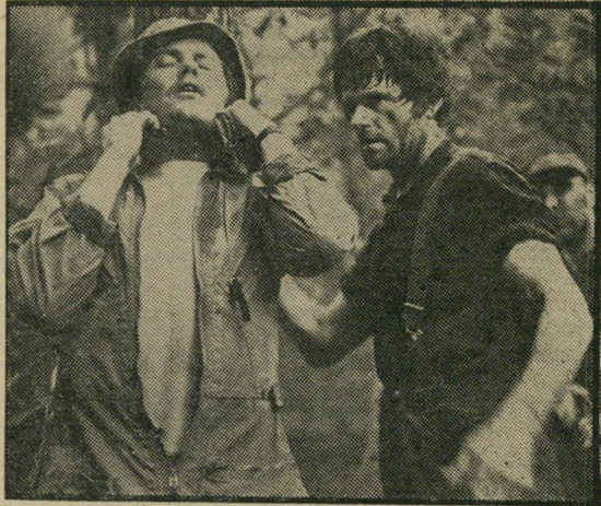
ג'ון וויט (משמאל), במלכודת: גבר אונס גבר

לזכות בורמן ודיקי יש לציין, שהצלחו להביא לידי ביטוי את כל הנקודות הללו, בסרט מותח, בו קיימת