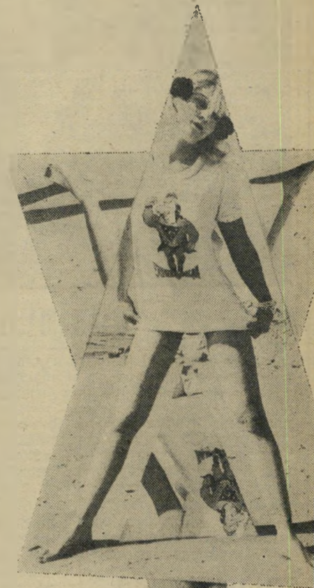
מגיודידיאבידן עיטור להקרבה

אולם כאשר הגעתי, בפברואר 1964, קיבל הפרופסור את פני בשאלה: "למה באתי?" מפני שאני יהודי, עניתי, מ- פני שחונכתי לציונות.