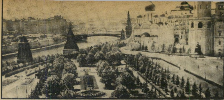
צידום הקרמלין על גבי גלזיה של יוסקה ג'י ד"ש לבבית