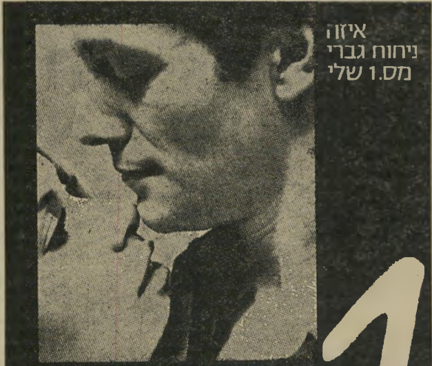
איזו ניחוח גברי שלי מס.1 שלי