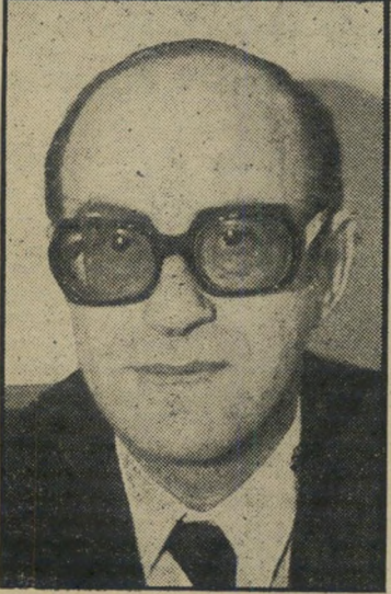
שופט וקך — ריח של סחטנות —

עורך-הדין גולדברג תבע באותו מכתב לפצות את מרשיו על „הנזקים שנגרמו להם כתוצאה מפירסום לשון-הרע ובגין אובדן פרנסתם במסעדה“ בסך של לא פחות מאשר 500 אלף (חצי מיליון) ל"י. מאחר שבכתבה האמורה לא זוהה