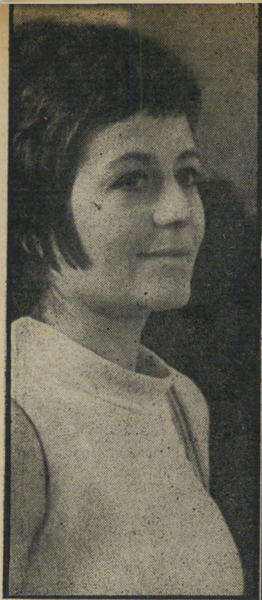
זיארארדו בן אורות החג שריד מתקופת האבן

השנה, ישבה ועדה והתלבטה מה להציג... במסגרת התחרות. טריפו ושברוס מוכנים להצטרף ללווי (שיציג את בית הבובות) ואל ברגמן (זעקות ולחישות), שהם אורי חים מהון לתחרות בפסטיבל. הרי לא נעים להשתתף ולא לזכות. ואילו קלוד לאלוש, שהיה אורח כזה לפני שנה (הרפתקאה היא הרפתקאה) אינו מוכן אפילו לכך. הלעג דאשקד הספיק לו. מה שנוגע לסרטיהם של אחרים — הועדה כבר ראתה המונים, אבל טרם החליטה. מסתבר אם כן שישראל נמצאת בחברה טובה, כשהמדובר בצרות בפסטיבל קאן.