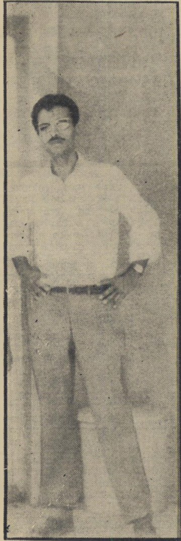
קבזן קברים יעיש

תמונות עירום בחורשה. הייתי צריכה ללכת לעשות קניות. סיפרה שושנה, והשארתי את הילדות אצל משר פחת יעיש. הייתי בדרך לשוק ופתאום בא יהודה והציע לקחת אותי בווספה עד למרכז. לא רציתי לנסוע איתו. אבל אשתו התערבה ובסוף נסעתי. נסעתי איתו ופתאום אני רואה שהוא