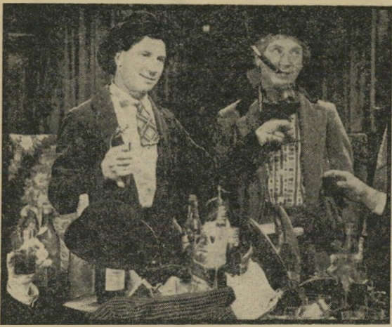
צ'יקו והארפו מארקס: מטורף

"בה" הוא פונה אל מרגרט דרמונט המיליונרית (שחקנית זו שימשה מטרה לחיצי בדיחותיהם של האחים בסרטים רבים), והיא משיבה לו "איני גבירתך הטובה" על כך, גרושו: "עברך אינו מעניין אותי". בכל פעם שהליצן המשושם נושע לרווחה, מספק הי במאי סם ווד המצאות חזותיות משעשעות לא פחות, כמו אותו תא אונייה המתמלא על גדותיו באנשים, עד אשר כאשר נפתחת הדלת, הם נשפכים החוצה בורם אדירים. אין כל טעם לפרט בכתב את מעללי האחים מארקס. חובה נעימה היא ללכת ולראות אותם.