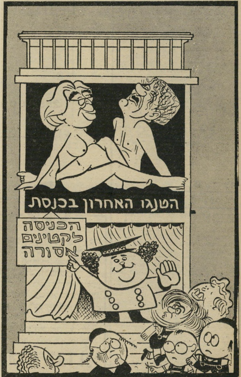
מתוך קאריקטורה של זאב ב,הארץ"

נקרא לציבור להחזיר לנו בקלפי את אשר הם גוזלים מאיתנו הלילה. ולא רק להחזיר את הגזילה — אלא גם