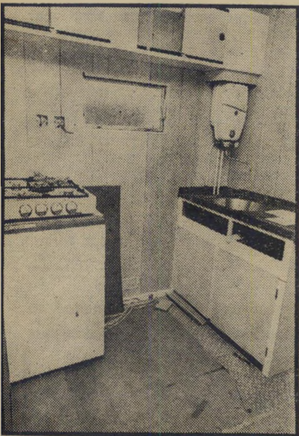
המיטבח כך נראה המיטבח של המעונות. בכל מיטבח כזה יש פינת בישול, עם כיריים של גז, עם מיתקן למים חמים. מקרר חשמלי קטן, ארונות מיטבח וכיור ני רוסטה. הציוד משובל, אולם השטח צר.

היא העובדה שאיש מכל הגופים, הנוגעים בדבר — משרד השיכון, משרד הקליטה והסוכנות היהודית — לא טרח לברוק אם בכלל ניתן להתגורר תקופה ממושכת בקופסאות סרדיניים על גלגלים אלה? במקורם נועדו הקראוואנים למטיילים. שיתגוררו בהם במסעותיהם וטיוליהם. בארץ הציבו אותם תחת כיפת השמיים, בשמש לוהטת ההופכת את החיים בתוך המעונות לבלתי נסבלים. "מה יש?" הגיב על כך דובר מחלקת השירותים של משרד