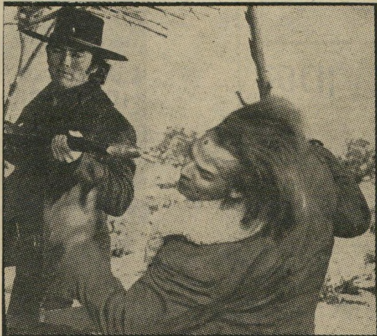
איסטווד וידיד: קל מדי

ג'ו קיד (אלנבי, תל-אביב, ארץ-צהרית) - קלינט איסטווד, הוא שוב הסופרנון השתקן, האל-