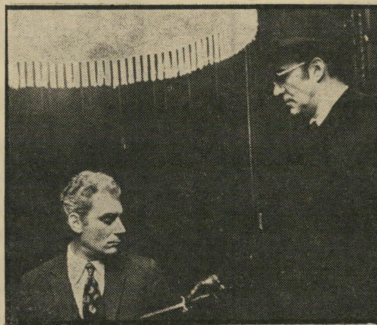
פיקולי ומריה-וולנטה: מציאה במציאות

ההתנקשות (צפון, תל-אביב, צרפת) - פרשת חטיפתו בפאר ריו, לפני שמונה שנים, של המנר