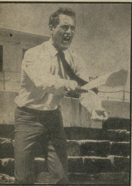
במאי ג'ומן התפעלות מהאשה

סביר בהחלט: ג'ון וודוורד החלה את הקאריירה שלה בפרס האוסקר שבו זכתה על הופעתה כנערה סכיופרנית בשלוש