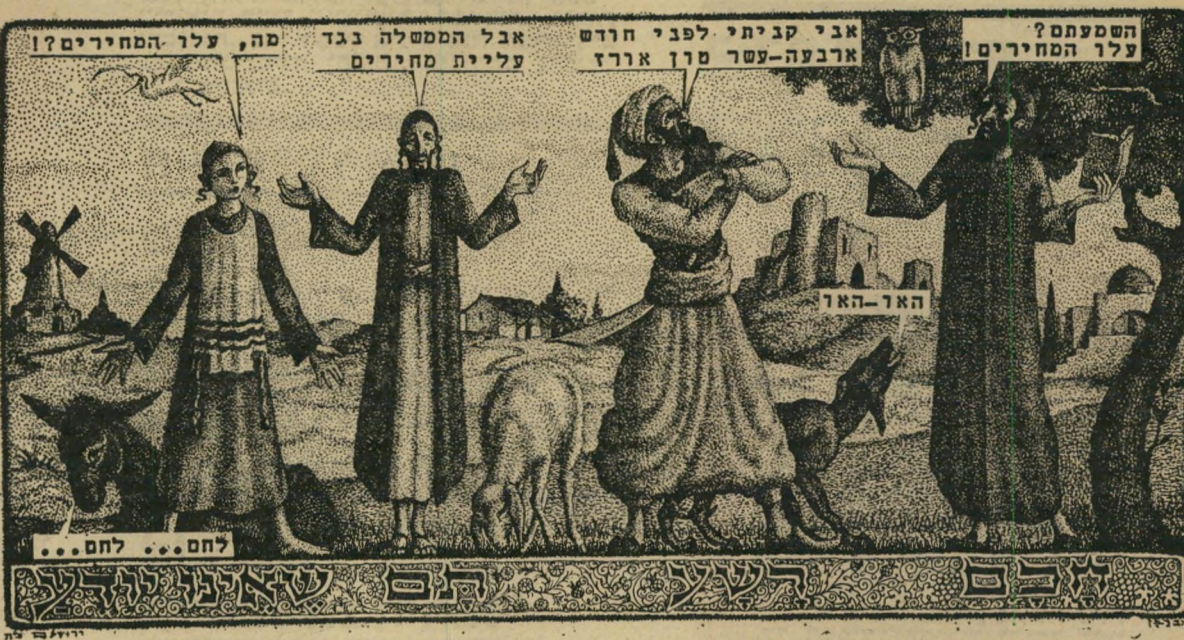
ההפסד העצום של הממשלה... לחם... לחם... לחם...