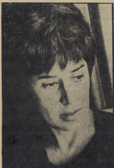
סופרת אבידר הכל — עד המיטה

לעצמה לכבד את גבר-חלומותיה בקפה וכריכים על שולחן פורמייקה רגיל בסלון — את תגיש לו אותם בתוך סל-ניצנים שקנית בעיר העתיקה, לשלגוסך טוגה רומאית — שאין כמוה, אגב, להסרת עורפי שומן — ולראשך עבאיה אותה, ספרי לו קיבלת במתנה משייך בדווי ממרחב סיני. לא תאמיני, אבל הוא מסוגל להאמין אפילו לזה.