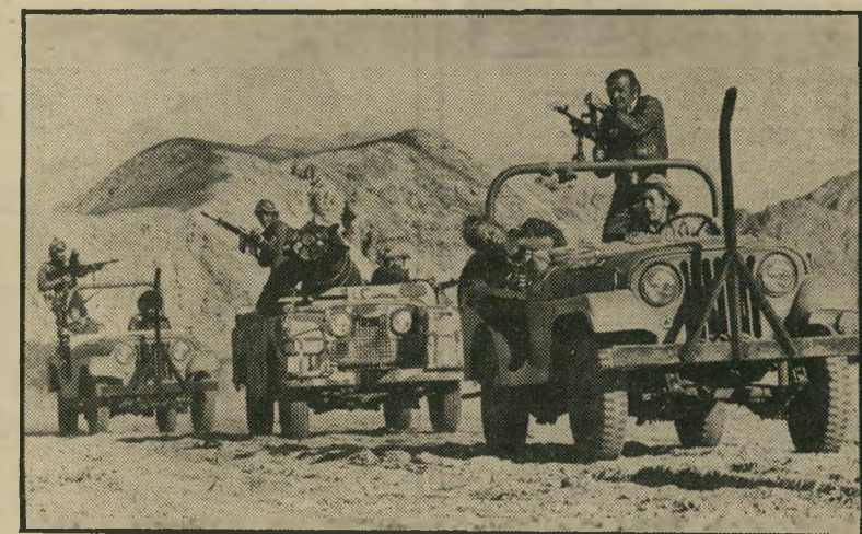
ותמונה מתוך סרט "סברה קומנד" — כעסק משתלם