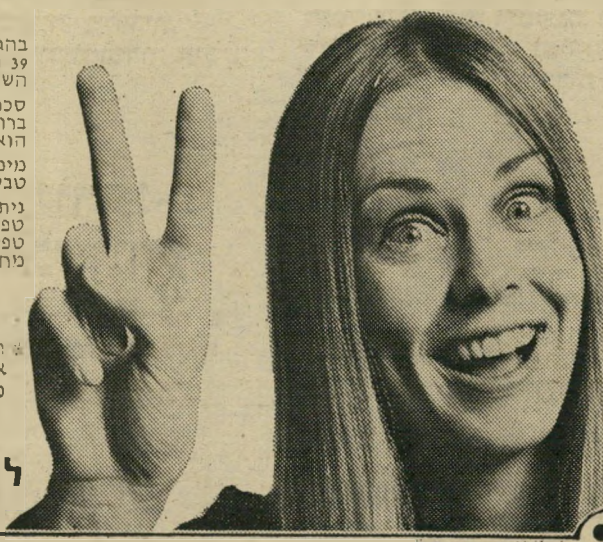
לשכת המכירות הממשלתית

הזכייה בפרס הראשון לכל טופס אינה יכולה לעלות על מכסימום של 250,000 ל"י.