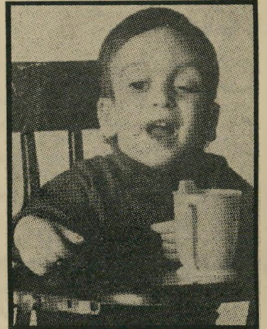
קורבן דיסאטונומיה מחר אזיל דמעה

החמורים ביותר שניתן להטיל על בני אדם: היעדר מוחלט של דמעות. חוסר חוש טעם, אי יכולת לחוש בכאב או להבדיל בין חום וקור, להקדים בלתי קבוע וחוסר גוף בלתי יציב, התקפות הקאה בלי תי ניתנות לשליטה, עצירה בגידול הגוף לגובה והחלשת ההתפתחות השכלית. למרבה המזל, לא כל הילדים היהודים החולים במחלה זו מקבלים את כל סימני ניה. אך בכמה מהם מתגלים כמה סימפי טומים בעת ובעונה אחת בצורה שאינה מאפשרת להם לימודים תקינים ומחייבת השגחה מתמדת. מוות בשנות העשרים. הדיסאטור נומיה אובחנה לראשונה בישראל ב-1949 במרכז רפואי בניו-יורק בידי שני רופאים. עד