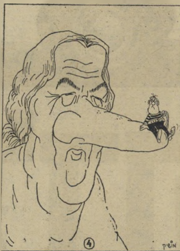
כוחו של אימון יפה לכל דבר (אליסטייר מקליין)