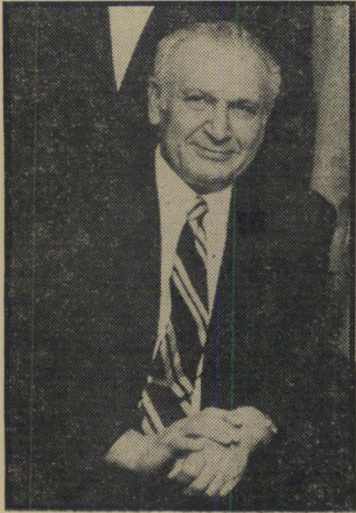
נשיא קציר בגנות הרודנות

של מלך הממלכה, הרי עונה סרוספור אפרים קצלסקי (שעיברת את שמו לקציר) שנבחר השבוע לתפקיד נשיא המדינה, על כל התכונות הנדרשות במעמד ייצוגי נעלה כזה, ואולי עוד יותר. הוא אומנם אינו בחיר אלוהים וגם לא בחיר העם, אלא בחירה של מיסלגה רודנית, שיותר ויותר חושפת את פרצופה האנטי-דמוקרטי תוך רמיסת כל ידיעה מתנגדת ותוך כפיית דיעותיה בצורה שרילודית. אולם כתר המדע אותו נושא אפרים קצלסקי נותן יסוד לתקווה כי הוא יתעלה בתפקידו מעל ומעבר לעסקני ה-מיסלגה הקטנוניים שסללו את דרכו לכהונה הרמה.